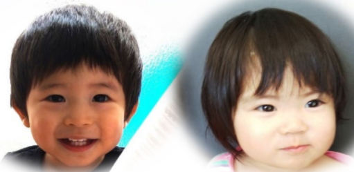
コスモス組 たかとくん、ねいちゃん